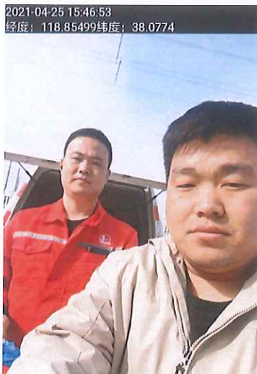
图 2 检测照片