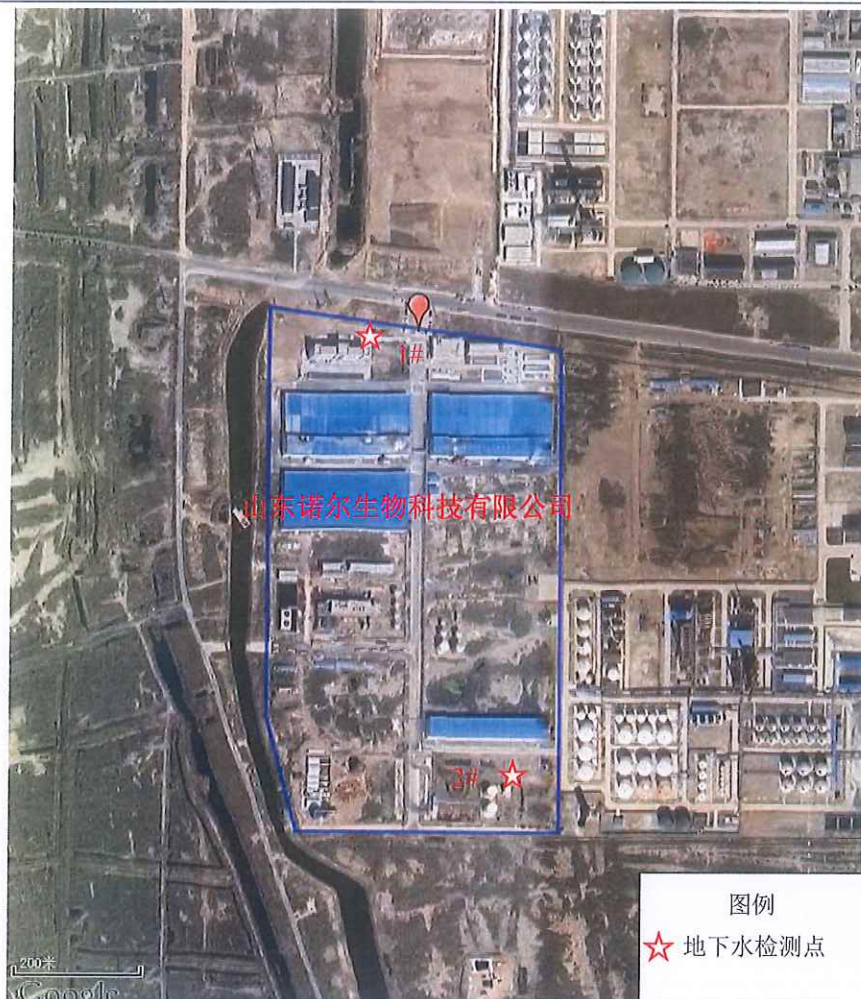
图 1 地下水检测点布设示意图